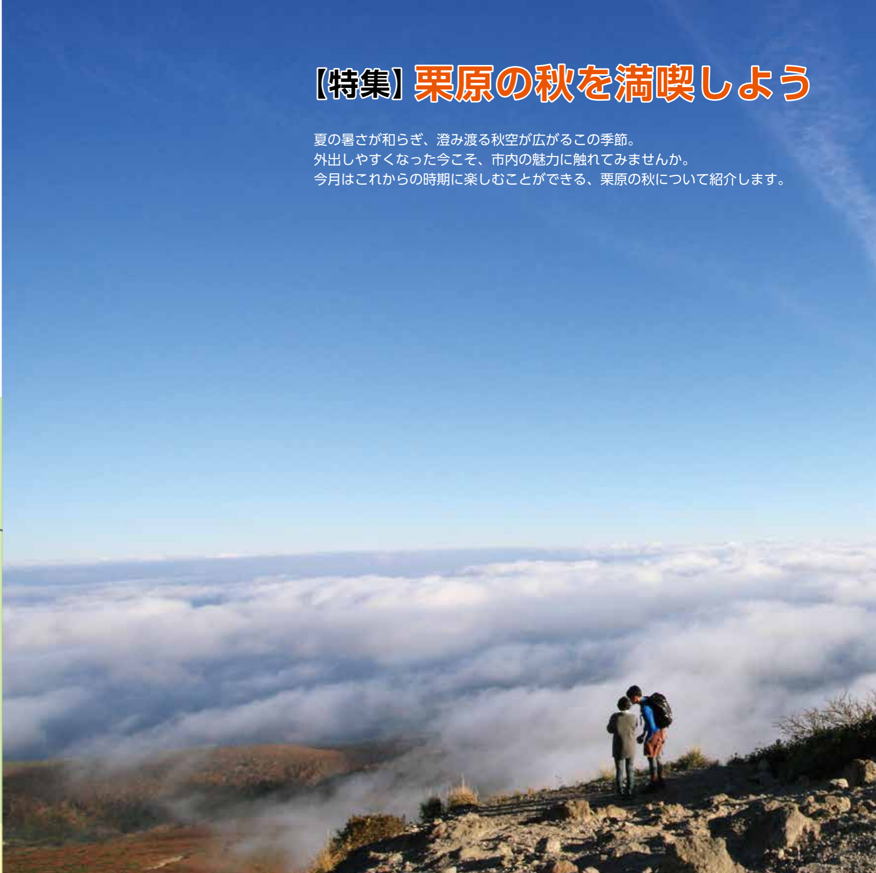
▲栗駒山山頂から望む雲海

夏の暑さが和らぎ、澄み渡る秋空が広がるこの季節。外出しやすくなった今こそ、市内の魅力に触れてみませんか。今月はこれからの時期に楽しむことができる、栗原の秋について紹介します。