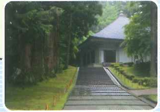
世界遺産 平泉 中尊寺 金色堂 (岩手県平泉町)