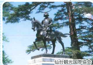
青葉城跡 (宮城県仙台市)