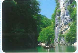
いひら 狢鼻溪 (岩手県一関市)