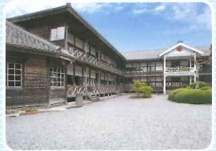
明治村 (宮城県登米市)