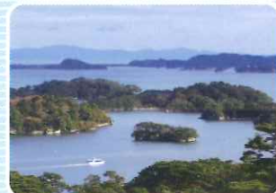
日本百景 松島 (宮城県松島町)